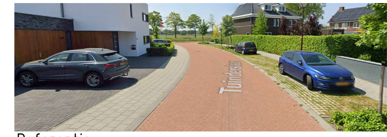
Referentie TUNDERSLAAN TE OUDENBOSCH