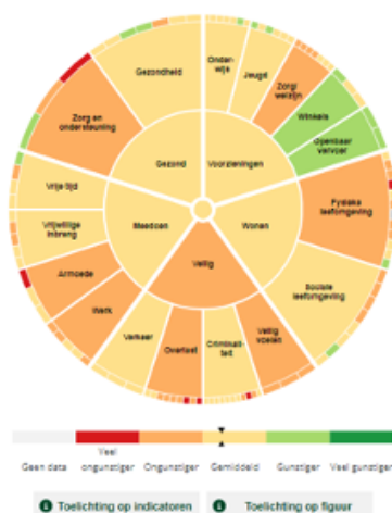
vergeleken met gemeente Roosendaal

Via https://roosendaal.incijfers.nl/content/wijk-in-beeld zijn data voor de thema's wonen, meedoen, gezondheid, voorzieningen en veiligheid voor iedereen toegankelijk gemaakt. Wijk in beeld gebruiken we om het gesprek aan te gaan met inwoners en maatschappelijke partners over wat er speelt op bijvoorbeeld een bepaald thema of in een specifiek gebied. Naast het delen van kennis helpt het daarbij ook om beter tot het 'verhaal achter de cijfers' te komen.