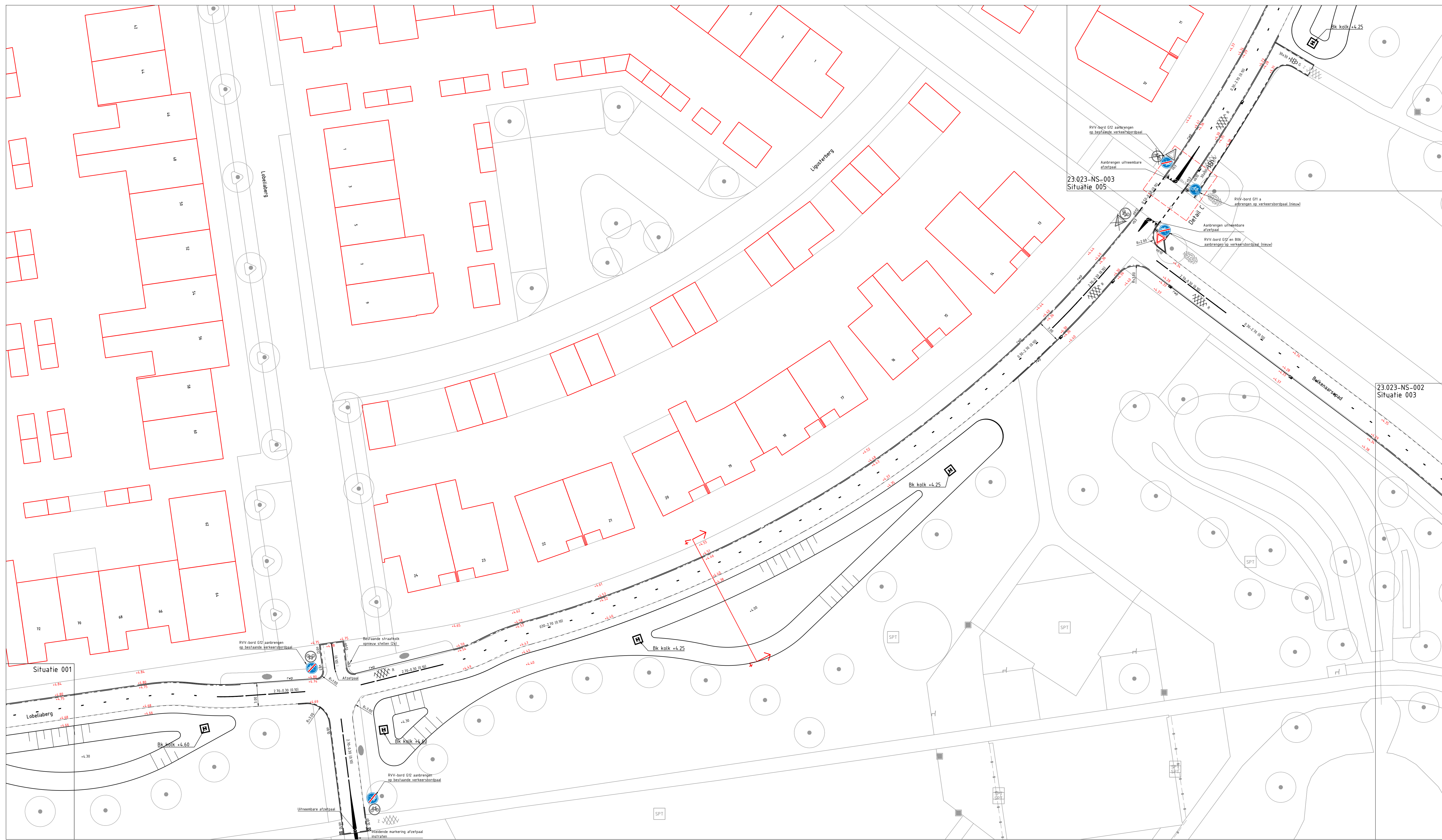
Situatie 002 Schaal 1:200