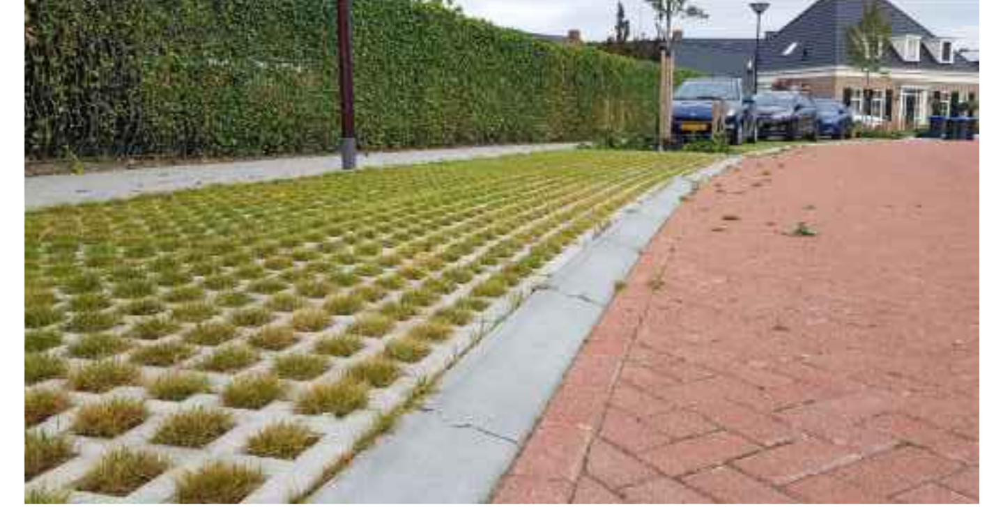
Referentie afbeelding Wilgenstraat te 'Oudenbosch