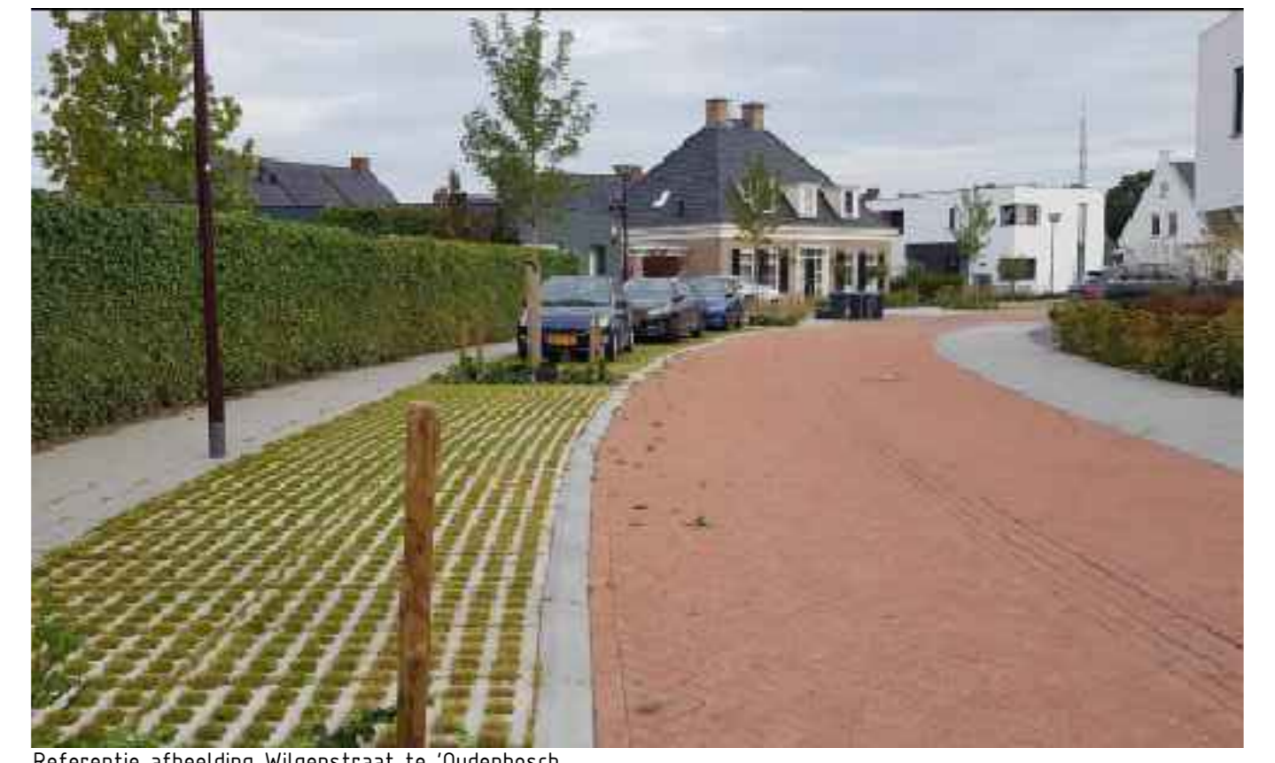
Referentie afbeelding Wilgenstraat te 'Oudenbosch