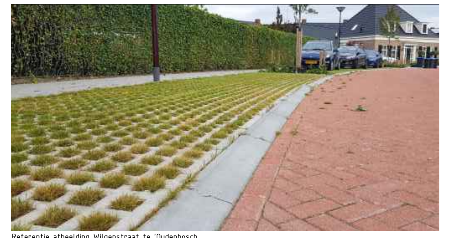
Referentie afbeelding Wilgenstraat te 'Oudenbosch