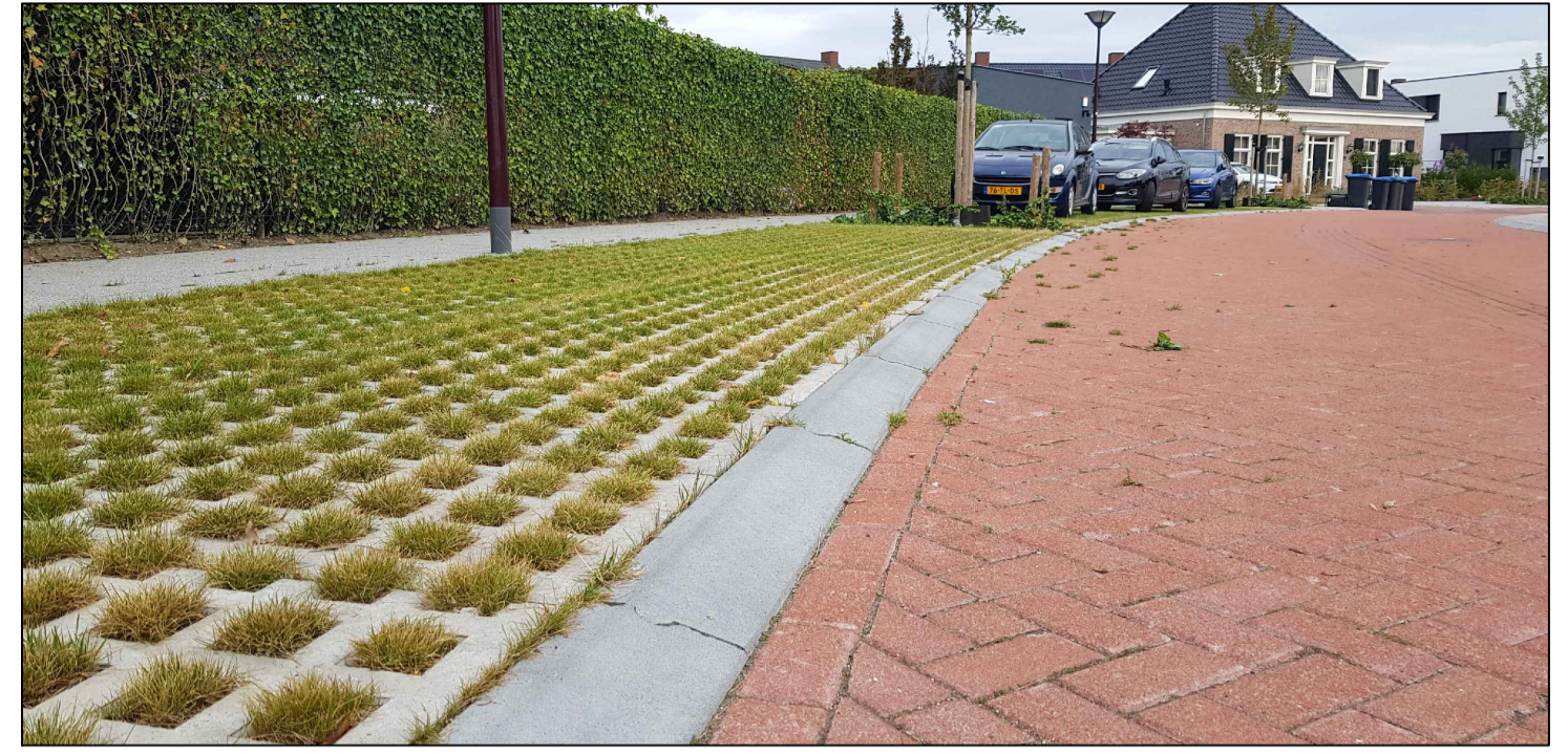
Referentie afbeelding "Wilgenstraat te Oudenbosch"