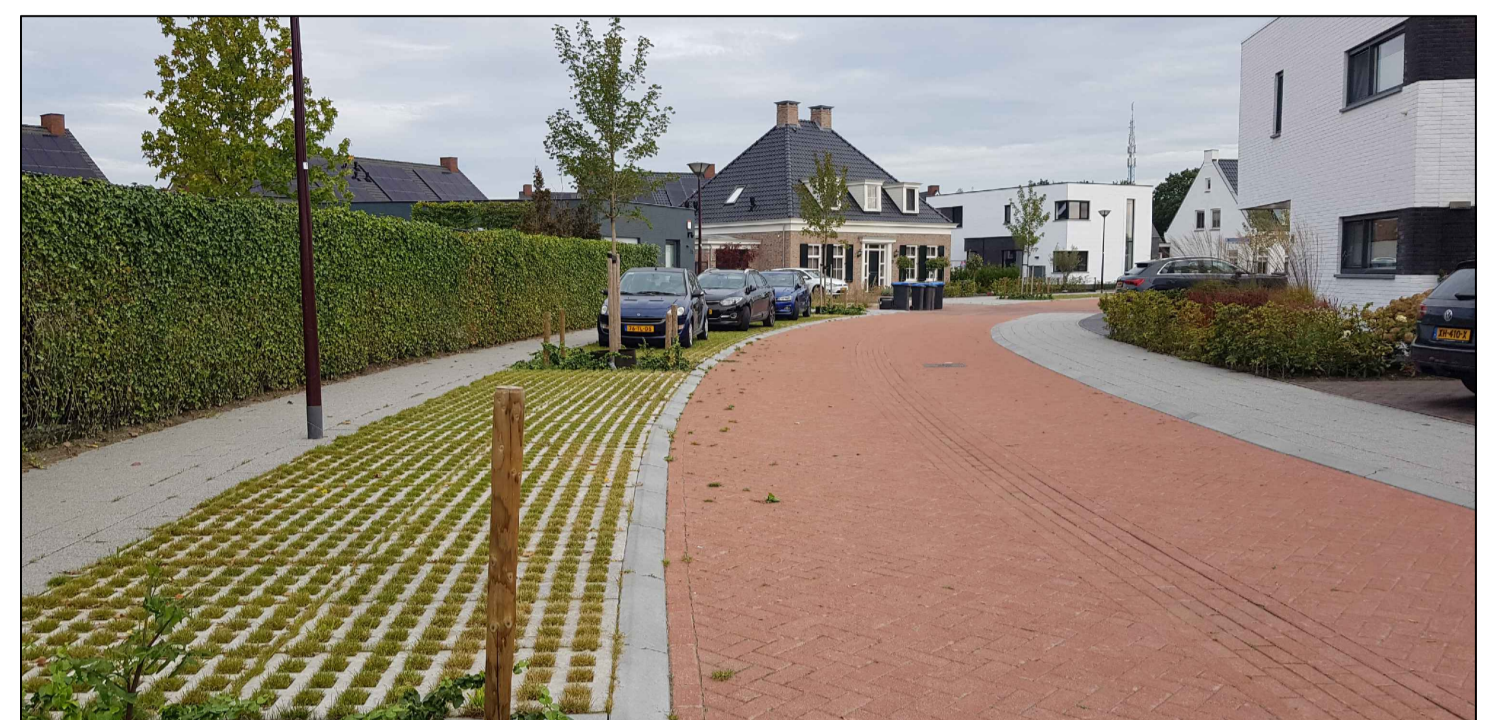
Referentie afbeelding "Wilgenstraat te Oudenbosch"