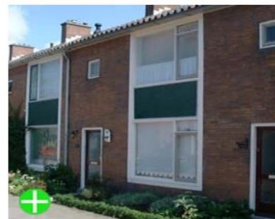
Bestaande indeling gerespecteerd bij wijziging