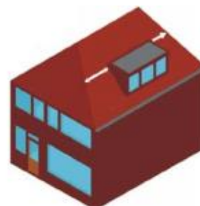
Bij schilddaken de kleinste afstand hanteren voor de plaatsing in het dakvlak