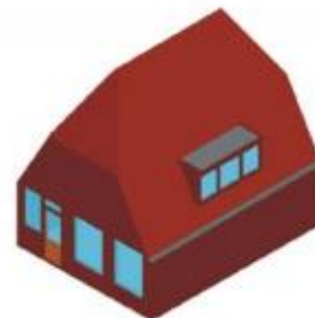
Dakkapel is ondergeschikte toevoeging aan dakvlak (dus niet op een wolfseind)