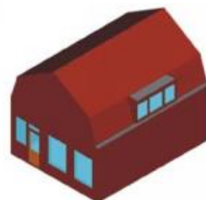
Dakkapel in mansardekap in onderste dakvlak plaatsen en aansluiten op knik