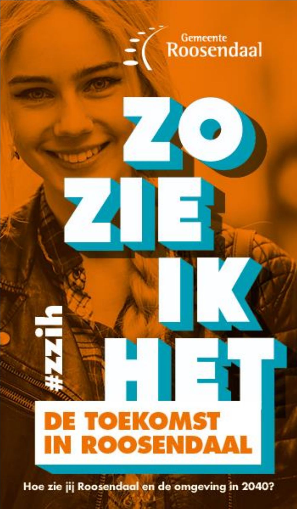
Verslag bijeenkomst professionals en organisaties, 16 november 2020